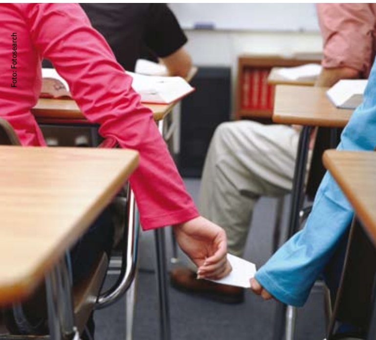
Kleine Störung mit großer Wirkung

„Gut auskommen“ ist kein Zufallsprodukt. Der Lehrer muss aktiv ein gutes Verhältnis zu jedem seiner Schüler aufbauen. Der Unterricht verlangt von Kindern viel Selbstkontrolle, die sie bislang, in der Familie, oft nicht gelernt haben. Daraus können sich schnell Konflikte zwischen Schüler und Lehrer ergeben. Gutes Classroom-Management hat zum Ziel, derartige Konflikte bereits im Vorfeld zu minimieren. Eine der wichtigsten Strategien dazu ist: Maximiere die Nähe zu deinen Schülern, um Probleme kleinzuhalten.