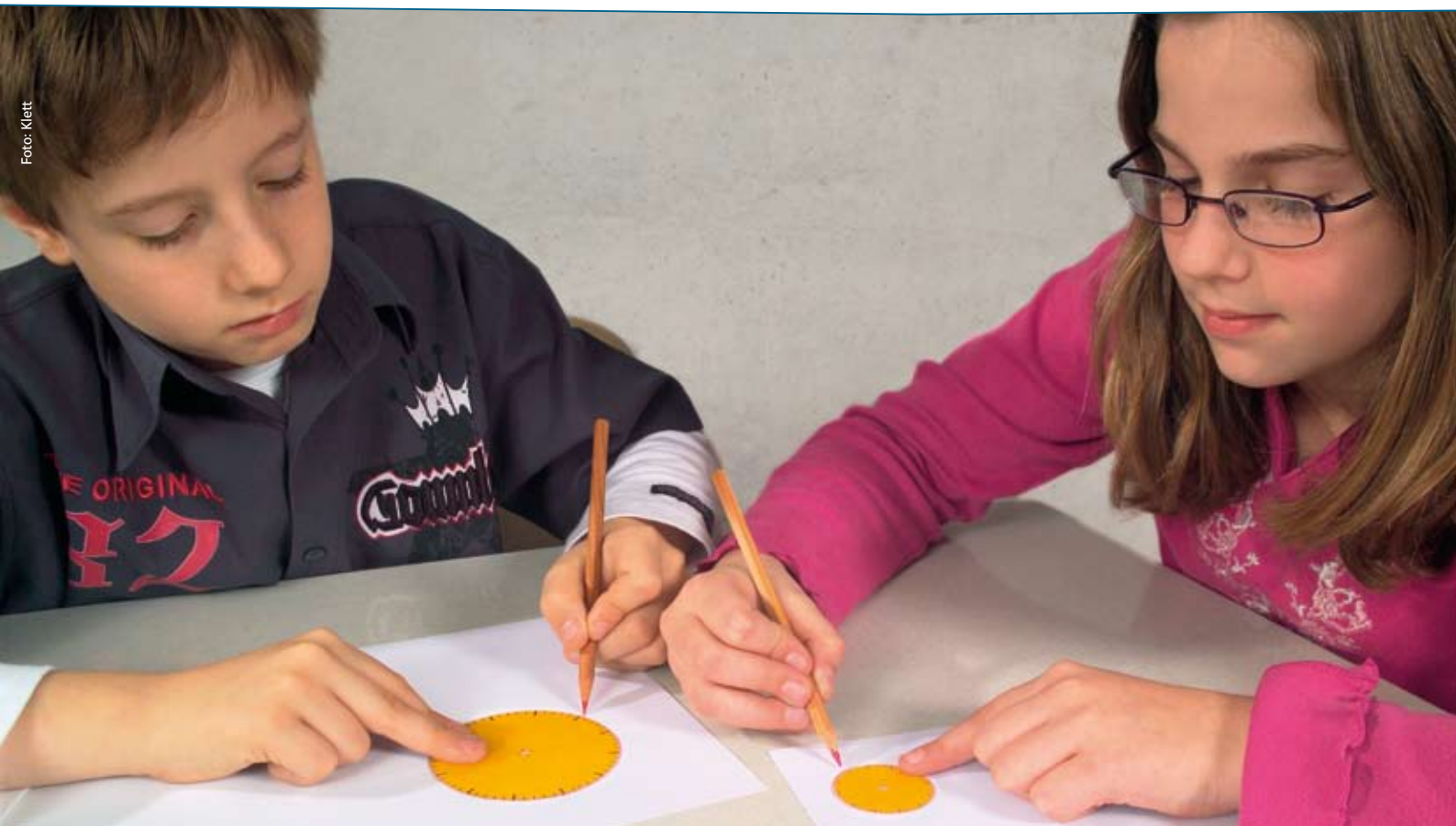
Mathematik entdecken: Schüler beim Erstellen von Bruchteilen.