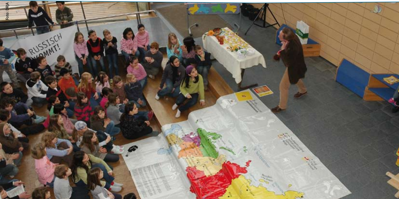
„Russisch kommt“: Aktionstag der Stiftung Deutsch-Russischer Jugendaustausch an einer Hamburger Grundschule